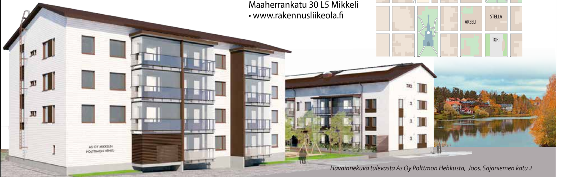
Havainnekuva tulevasta As Oy Polttimon Hehkusta, Joos. Sajaniemen katu 2