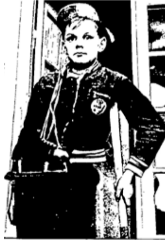
KIRJOITTAJA ON KAMPPARI, ERÄS 7-JÄSENEISTÄ PERUSTAJAJOUKKUEESTA.