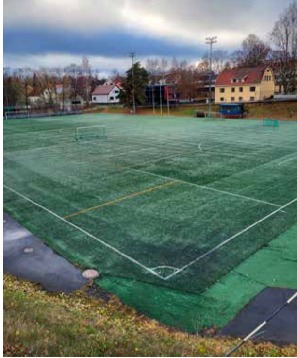
Hänskissä ei ole aloitettu vielä tekojään tekemistä 1.11.2022