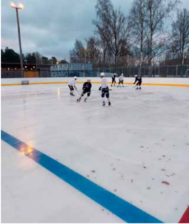
Jääpallon akatemia pääsi ensimmäisenä Urpolan tekojälle 1.11.2022