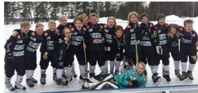
Suurkiitos pelaajien perheille, tukijoillemme ja kannustajille hienosti sujuneesta kaudesta!