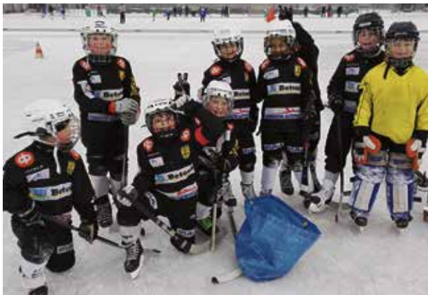
Iloiset ilmeet Lappeenrannan turnauksessa.

Syksyllä harjoitukset pitivät sisällään kuivaharjoittelua Urpolan maastoissa, kaukalolla sekä jäähalliharjoituksia. Lokakuun ensimmäinen päivä pidettiin ensimmäinen jääleiripäivä Savitaipaleen jäähallissa yhdessä P11 joukkueen kanssa. Ensimmäisen harjoituspuelin saimme marraskuun alussa Varkauteen, jossa pelattiin kovat pelit iloisella ilmeellä hieman vanhempien pelaajia vastaan. P9 joukkueen kauteen kuului kaksi