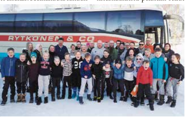
P11 joukkue Haaparannan lopputurnauksessa.